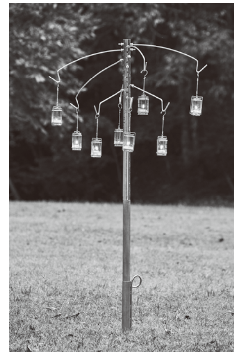
ワイヤーを追加した例

6 オプションのワイヤーを追加することで シャンデリアのような使い方ができます。