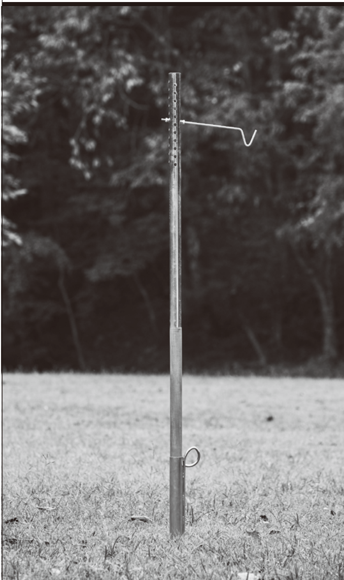
ショートモデルでの完成図